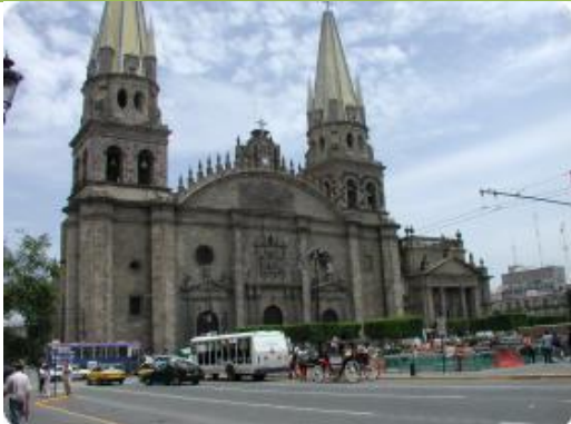
Catedral Metropolitana de Guadalajara Av. Alcalde #10, Centro Guadalajara, Jalisco, México Tel. (33) 3614-5504