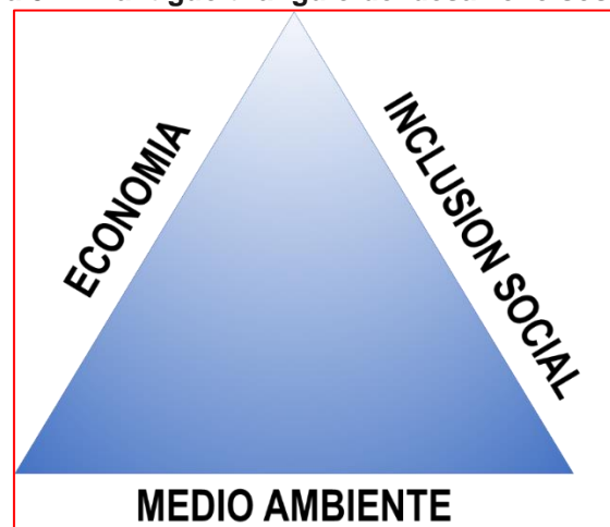
Figura 01: El antiguo triángulo del desarrollo sostenible

En una sociedad con una diversidad creciente (no solo diversidad étnica), que necesita valorar el conocimiento y el aprendizaje permanente, eso está conectado (al menos potencialmente) con todas las sociedades de la palabra ... Tú, él, ella, yo, nosotros ... necesitamos construir un pilar cultural (figura 02) que nos ayude a entender el mundo, al descubrir que nuestras raíces, nuestras tradiciones, nuestras culturas, no son evidentes, construyendo sobre nuestro desarrollo humano a través del acceso a, y practicar con, actividades culturales.