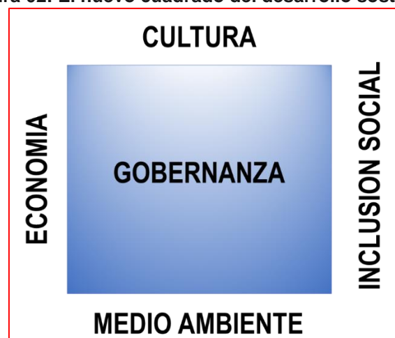
Figura 02: El nuevo cuadrado del desarrollo sostenible

Los actores culturales saben mejor que nadie que el círculo de desarrollo no se puede cuadrar sin el cuarto pilar: la cultura. El marco propuesto por Jon Hawkes es extremadamente poderoso. Como agentes y agentes culturales, necesitamos